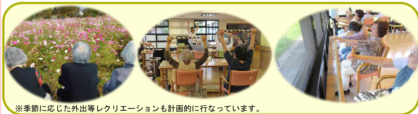
※季節に応じた外出等レクリエーションも計画的に行なっています。