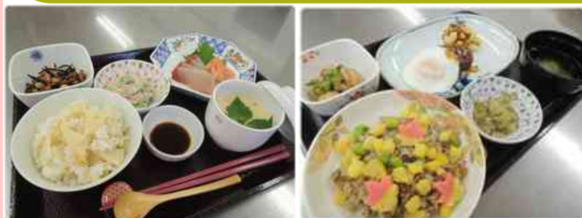
◇季節毎の行事食等、食事にも力を入れています